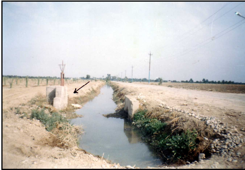
شكل (٢) قناة الري الرئيسية والناظم القاطع في محطة نخيل العمارة

وبلغ معدل درجة تفاعل هذه التربة (PH) (٧,٦) وهذه الدرجة تتلائم وزراعة اشجار النخيل التي يوجد نموها في درجة تفاعل تتراوح بين (٥,٥-٨,٠) (مرعي/١٩٨٠/١٣٦). اما درجة ملوحة التربة فقد بلغ معدلها (٦,٦) ديسي سيمنز/ م فهي اذن تربة متوسطة الملوحة (Medium Saline) حسب تصنيف (U.S.D.A 1954)، وهذا المستوى من ملوحة التربة يعد مناسباً لزراعة اشجار النخيل التي هي اكثر المحاصيل تحملاً للملوحة لان جذور النخلة لا تمتص الاملاح الفائضة من التربة (عبدالحسين/١٩٨٥/٩). اما بالنسبة للمواد العضوية فقد بلغ معدل نسبتها في تربة منطقة الدراسة (١,٢١%)، وكان هذا المعدل للعمق الاول (٥٠-٠) سم (١,٦٦%) بينما كان للعمق الثاني (٥٠-١٠٠) سم (٠,٧٦%) بسبب انتشار النباتات والحشائش التي تشكل مصدراً للمواد العضوية عند الطبقة السطحية للتربة وتناقصها مع زيادة العمق. واخيراً فيما يخص المورد المائي لمشروع زراعة امهات النخيل في محطة نخيل العمارة فانه يتمثل بمياه جدول الكحلاء الذي يتفرع من نهر دجلة عند مدينة العمارة وفي نقطة تقع شمال موقع المشروع بحوالي (٣ كم) ، وقد نصبت على هذا الجدول مضخة سقي قدرتها (٥٠ حصاناً) تعمل بالتيار الكهربائي وفي فترات انقطاعه يمكن تشغيلها بوقود الديزل وذلك لتزويد فساتل النخيل في المحطة بالمياه عبر قناة رئيسية طولها (١٦٥٠ م) شقت لهذا الغرض وانشىء ناظمين قاطعين احدهما في منتصف قناة الري الرئيسية والاخر في نهايتها لتنظيم جريان مياه الري بين قناة الري الرئيسية من جهة وحوضي تجميع المياه لتغذية طاقم الري من جهة اخرى. (شكل ٢). يبلغ المعدل السنوي لتصريف جدول الكحلاء (٩,٧٢ م ٣ /ثا) وبمعدل منسوب قدرة (٧,٥١ م)، اما معدل ايراده المائي السنوي فيبلغ حوالي (٢,٢٩٦ مليار م ٣ /م ٢ ) جدول (٣).